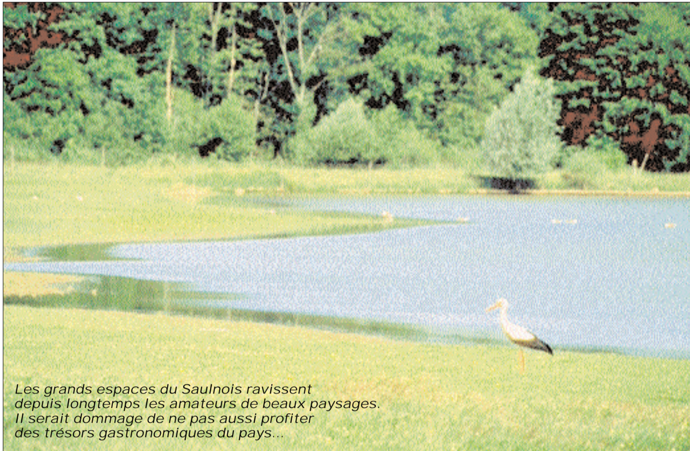
Les grands espaces du Saulnois ravissent depuis longtemps les amateurs de beaux paysages. Il serait dommage de ne pas aussi profiter des trésors gastronomiques du pays...

Le Saulnois, c'est aussi une population hospitalière, qui cultive l'art de vivre et le bon goût. Ce sont ces hommes et ces femmes qui célèbrent chaque jour le terroir et l'amour du beau produit. Ils sont éleveurs d'escargots, producteurs de foie gras, affineurs, aviculteurs ou bouilleurs de cru... Nous sommes partis à leur rencontre, avec une gourmandise que nous espérons contagieuse.