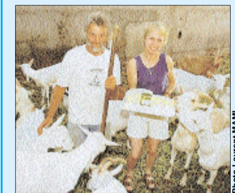
Les fromages frais de Bacourt : à vous rendre chèvre !

Faisselle de chèvre, bûche cendrée et chèvre frais. Excellente tomme au cumin.