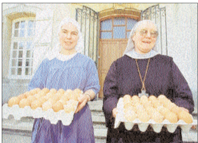
Frais, bien calibrés et servis sur un plateau !

Fidèles à l'esprit bénédictin, les sœurs d'Oriocourt vivent de leur travail. Tandis que d'autres font du miel ou des liqueurs, la communauté du Saulnois donne dans l'aviculture : 3 000 poules élevées au grain dans le poulailler de l'abbaye, et des œufs dont la réputation n'est plus à faire. « Nous sommes une petite communauté priante et laborieuse. Notre tenue de travail, c'est la blouse au poulailler et le jean's au verger ! ».